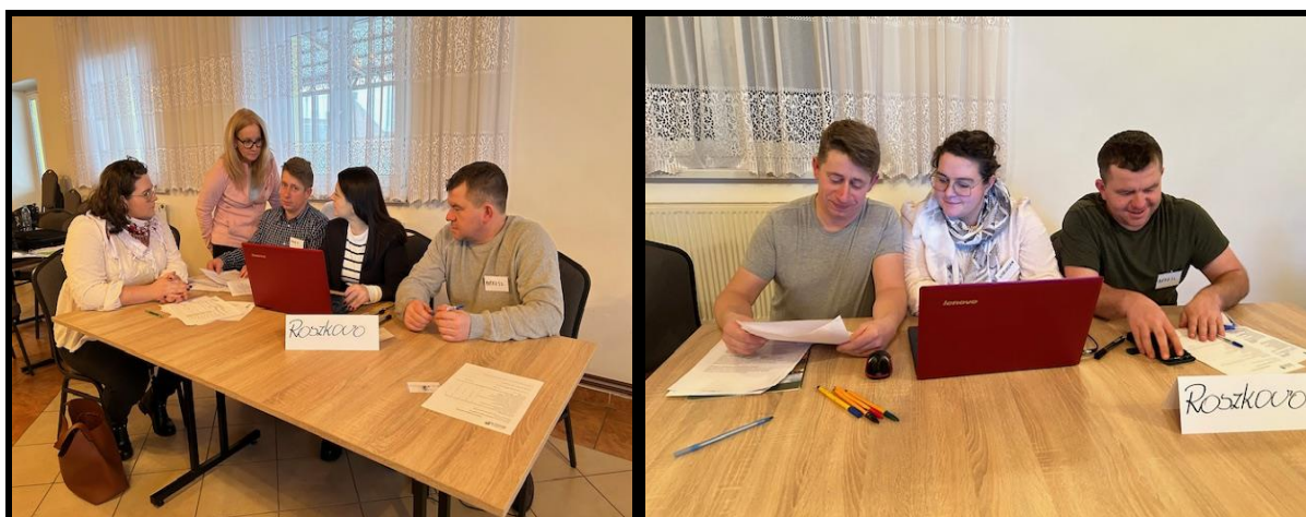
Grupa Odnowy Wsi w czasie warsztatów opracowania Sołeckiej Strategii Rozwoju Świetlica wiejska w Zakrzewie w dniach 18-19.I.2024 r.

SOLECKA STRATEGIA ROZWOJU – ROSZKOWO wypracowana przez GOW na warsztatach w ramach programu UMWW - „Wielkopolska Odnowa Wsi 2020+”