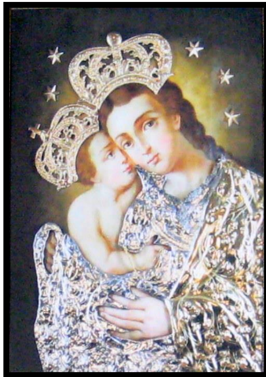
Obraz MB Pocieszenia w Zakrzewie