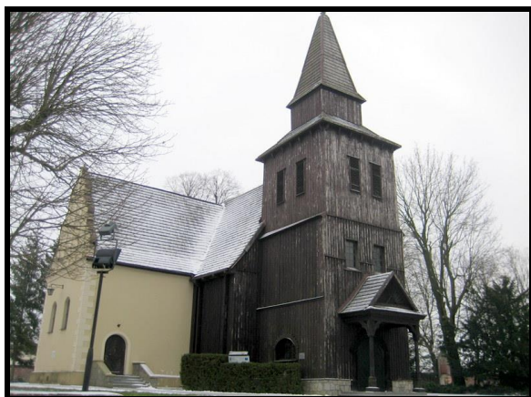
Kościół pw. św. Klemensa oraz Sanktuarium Matki Bożej Pocieszenia