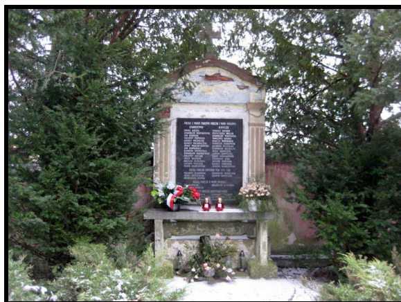
Żywa pamięć o lokalnych bohaterach