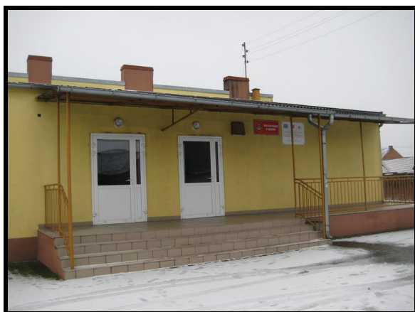
Świetlica wiejska oraz remiza OSP