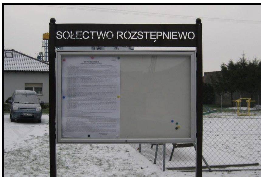
Tablica informacyjna sołectwa