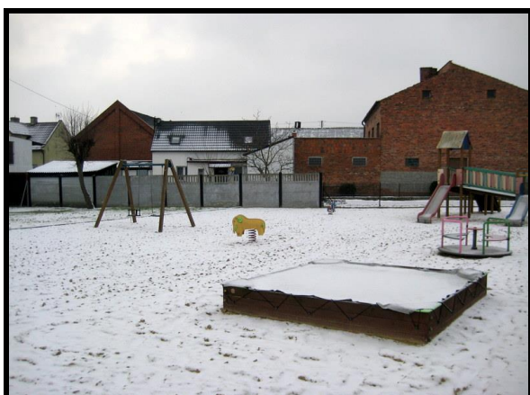
Miejsce rekreacji dla najmłodszych