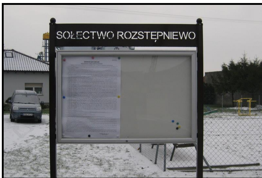
Tablica informacyjna sołectwa

SOŁECKA STRATEGIA ROZWOJU – ROZSTĘPNIEWO wypracowana przez GOW na warsztatach w ramach programu UMWW - „Wielkopolska Odnowa Wsi 2020+”