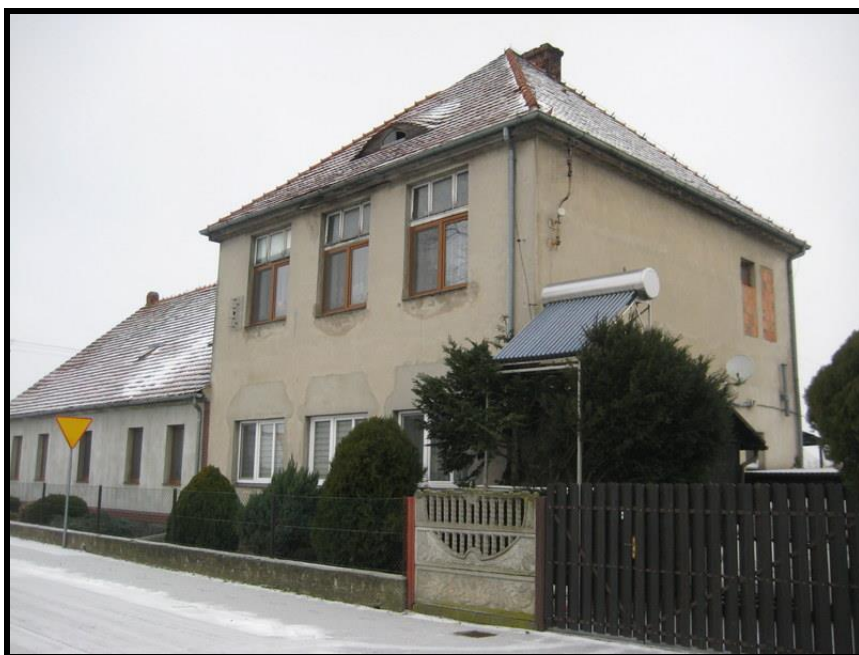
Budynek dawnej szkoły zaadaptowany na mieszkania

ZASOBY – wszelkie elementy materialne i niematerialne wsi i związanego z nią obszaru, które mogą być wykorzystane obecne bądź w przyszłości w realizacji publicznych bądź prywatnych przedsięwzięć odnowy wsi. Zwrócić uwagę na elementy specyficzne i rzadkie (wyróżniające wieś). Opracowanie: Ryszard Wilczyński