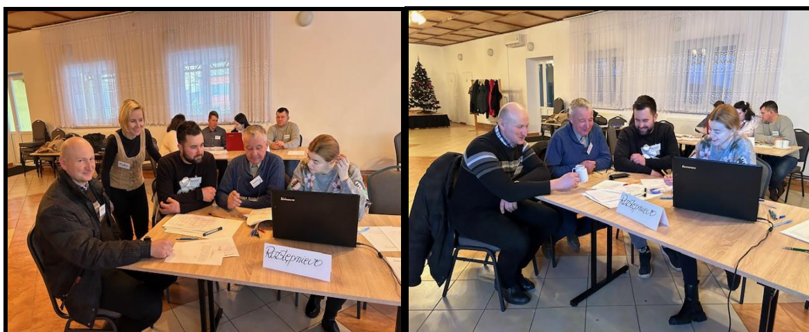
Grupa Odnowy Wsi w czasie warsztatów opracowania Sołeckiej Strategii Rozwoju Świetlica wiejska w Zakrzewie w dniach 18-19.I.2024 r.

SOLECKA STRATEGIA ROZWOJU – ROZSTĘPNIEWO wypracowana przez GOW na warsztatach w ramach programu UMWW - „Wielkopolska Odnowa Wsi 2020+”