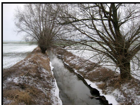
Walory przyrodnicze sołectwa – Rzeka Dąbroczna