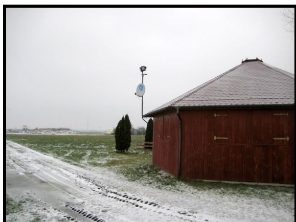
Altana z terenem rekreacyjno-sportowym