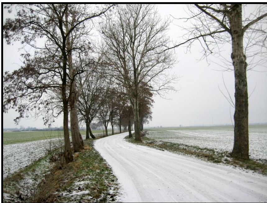
Walory przyrodnicze sołectwa