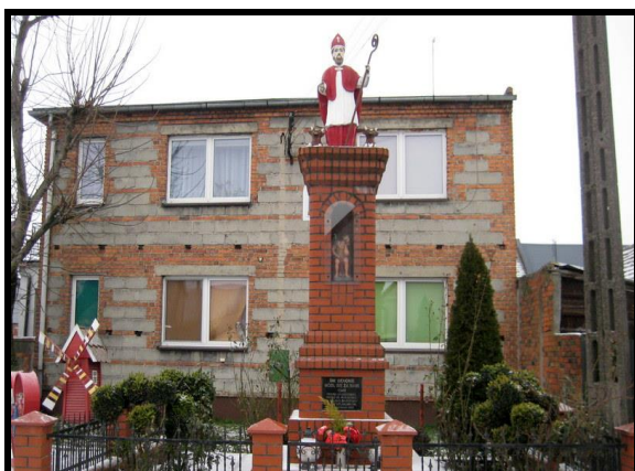
Miejsce kultu religijnego