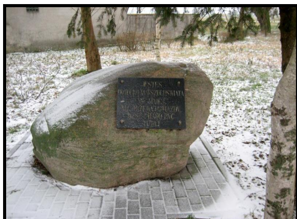
Kamień upamiętniający Dni Roszkowa