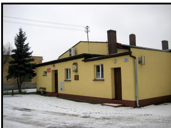
Świetlica wiejska oraz remiza OSP