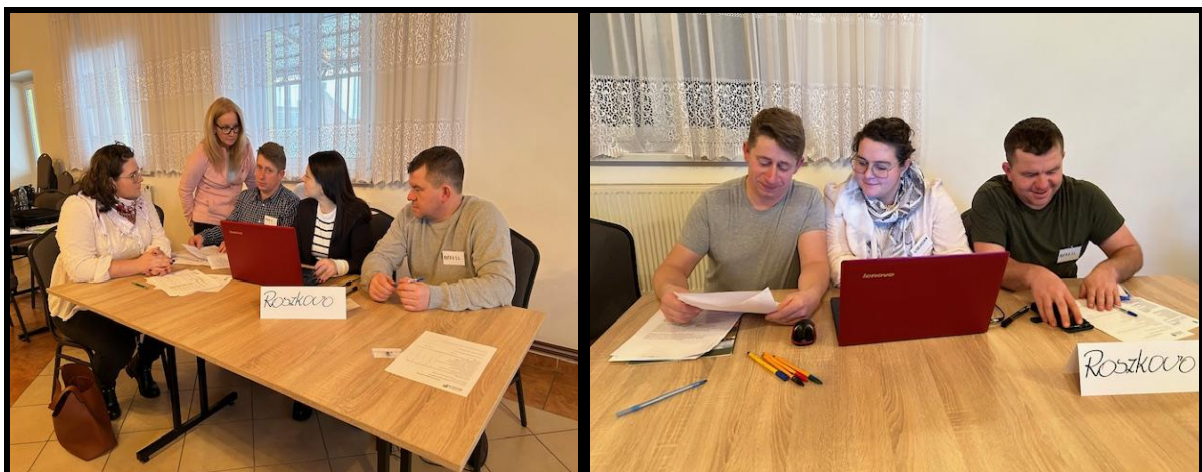
Grupa Odnowy Wsi w czasie warsztatów opracowania Sołeckiej Strategii Rozwoju Świetlica wiejska w Zakrzewie w dniach 18-19.I.2024 r.

SOLECKA STRATEGIA ROZWOJU – ROSZKOWO wypracowana przez GOW na warsztatach w ramach programu UMWW - „Wielkopolska Odnowa Wsi 2020+”