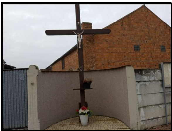
Miejsce kultu religijnego