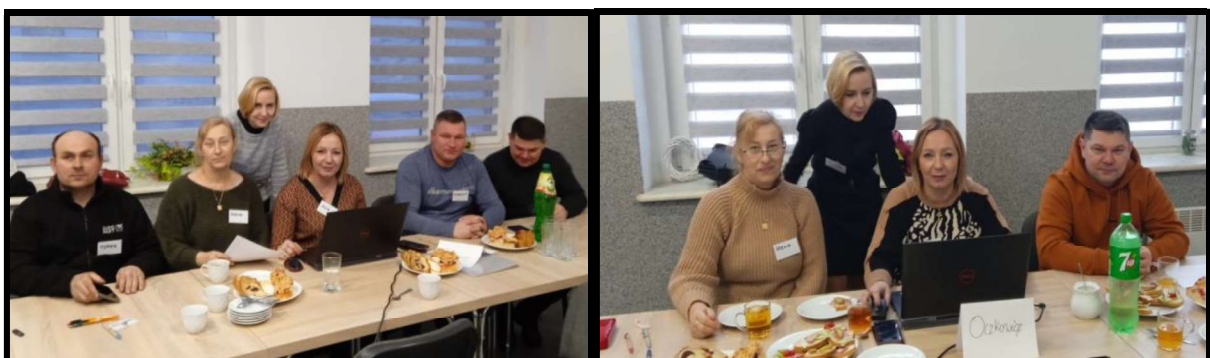
Grupa Odnowy Wsi w czasie warsztatów opracowania Sołeckiej Strategii Rozwoju Świetlica wiejska w Woszczekowie w dniach 20-21.I.2023r.