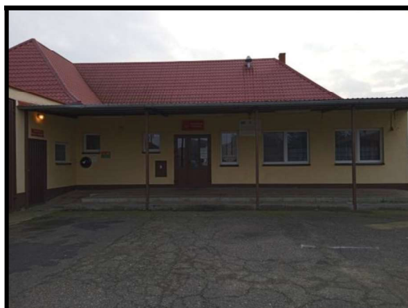
Świetlica wraz z remizą OSP