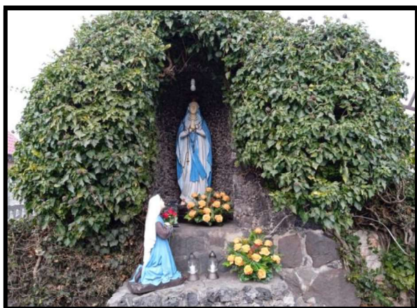
Miejsce kultu religijnego