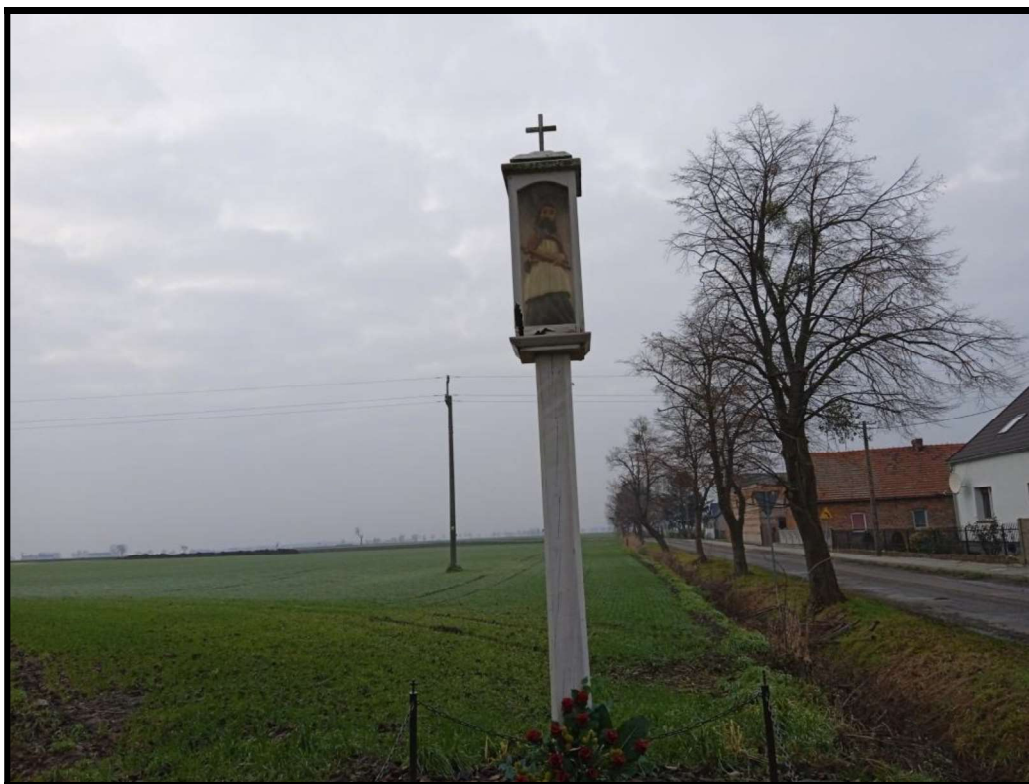
Figura św. Nepomucena

SOŁECKA STRATEGIA ROZWOJU – OCZKOWICE wypracowana przez GOW na warsztatach w ramach programu UMWW - „Wielkopolska Odnowa Wsi 2020+”