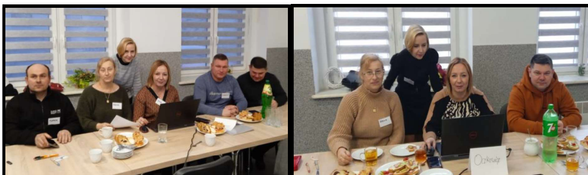
Grupa Odnowy Wsi w czasie warsztatów opracowania Sołeckiej Strategii Rozwoju Świetlica wiejska w Woszczówce w dniach 20-21.I.2023r.

SOLECKA STRATEGIA ROZWOJU – OCZKOWICE wypracowana przez GOW na warsztatach w ramach programu UMW - „Wielkopolska Odnowa Wsi 2020+”